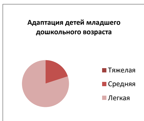
Рисунок 2 Адаптация детей младшего дошкольного возраста (3-4 года)

Результаты наблюдений свидетельствуют об успешной адаптации детей раннего возраста к Учреждению. Дети стали лучше говорить, кушать самостоятельно, знают элементарные навыки самообслуживания. Основные причины протекания адаптации в тяжелой форме у детей: частые заболевания, неподготовленность к режиму и питанию в детском саду, сильная привязанность к родителям, отсутствие единства требований в воспитании ребенка. С родителями детей, чей адаптационный период протекал в тяжелой форме, были проведены индивидуальные консультации, а также вывешен наглядный материал на информационном стенде.