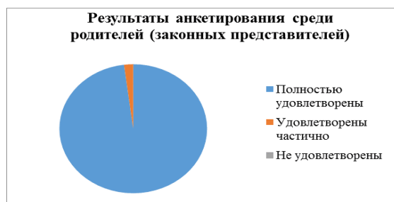
Рис.1 – Анализ результатов удовлетворенности родителей реализацией образовательной программы

В мае 2023 года был проведен ежегодный мониторинг среди родителей по вопросу удовлетворенности участников образовательного процесса результатами внедрения ФГОС ДО, реализации образовательной программы. В анкетировании приняли участие 300 родителей, в результате - полностью удовлетворены 98 %, частично 2%, не удовлетворены 0%.