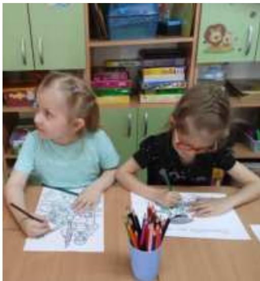
Рисование «День Победы»