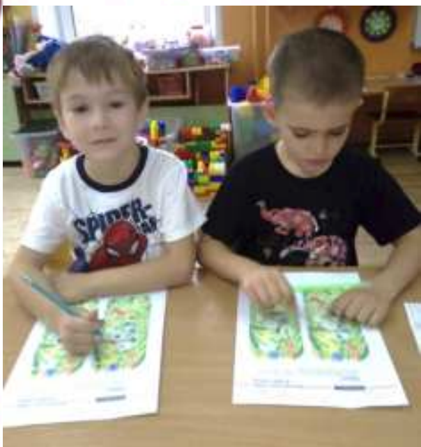
Выполнение заданий в рабочей тетради