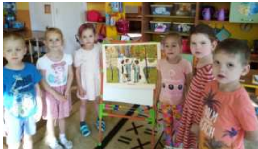
Тематическое занятие «День воспитателя»