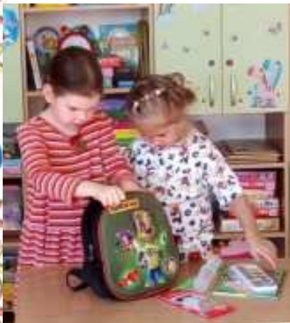
Тематическое занятие «День знаний»