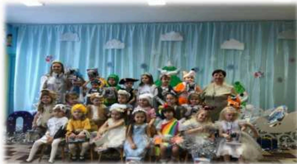
Подготовка к Новому году