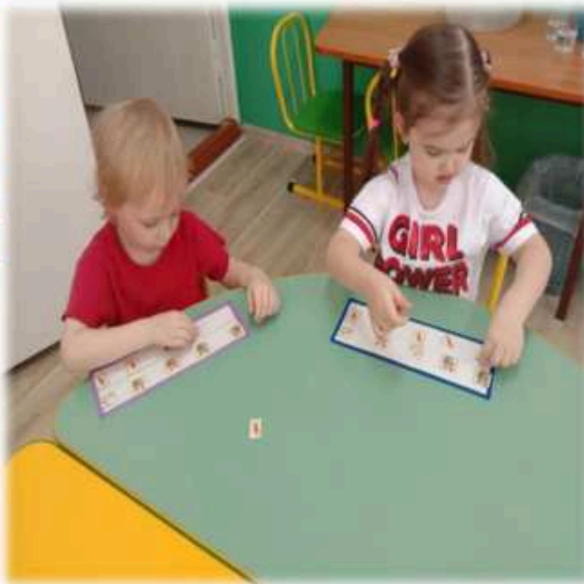
Работа со счетными палочками