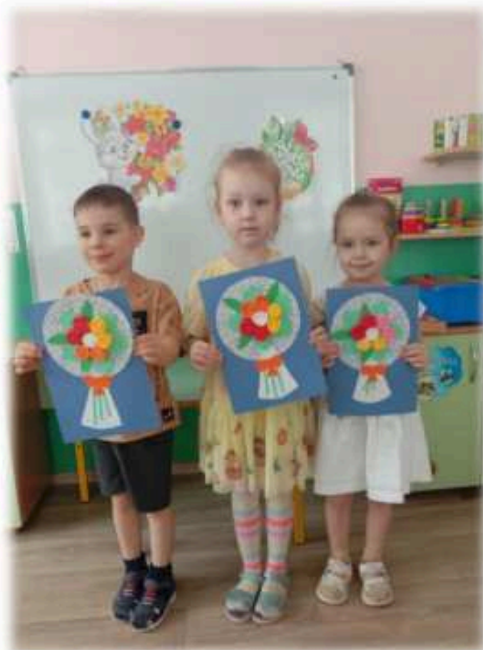
«Букет для мамы»