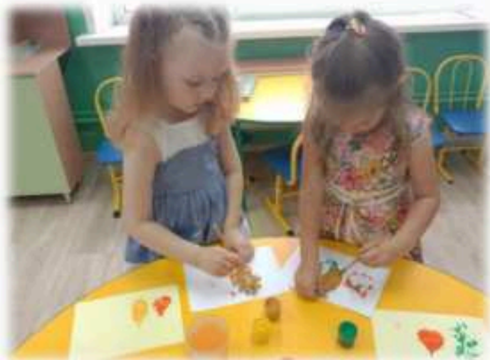
Рисование «Осенние деревья»