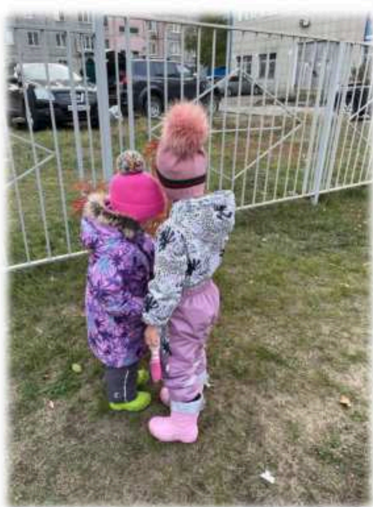
Наблюдение за почками рябины